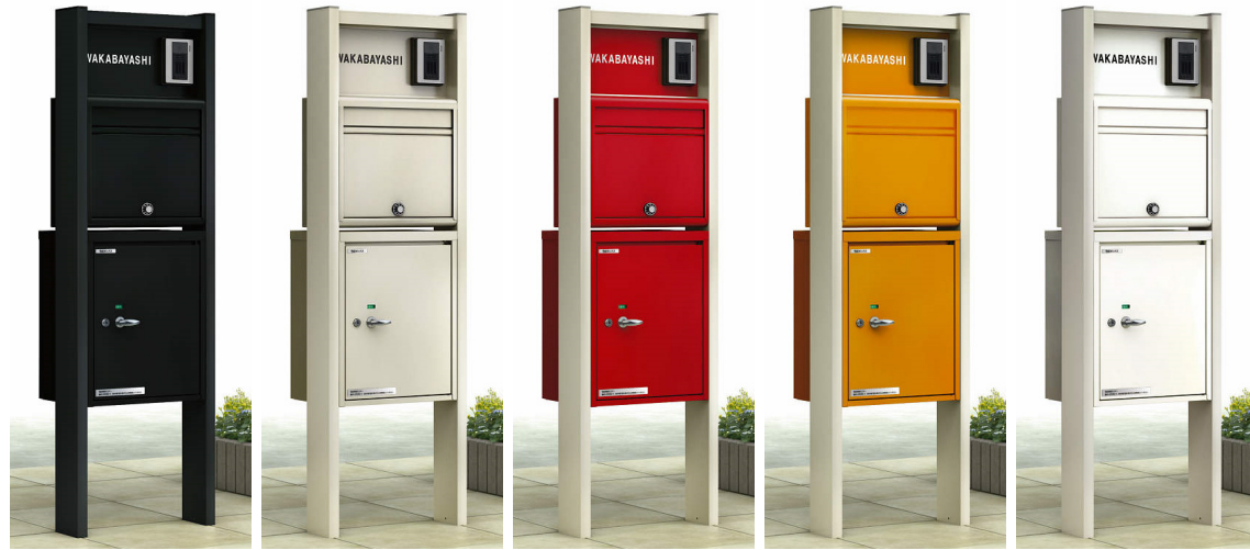
B7:カームブラック H2:プラチナステン VE:レッド VG:オレンジ YW:ホワイト ※レッド、オレンジ、ホワイトの場合、「ポスティモα」の上枠、柱色はプラチナステンとなります。