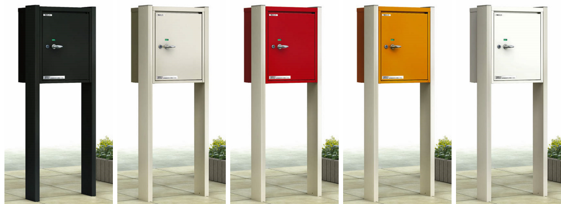
B7:カームブラック H2:プラチナステン VE:レッド VG:オレンジ YW:ホワイト