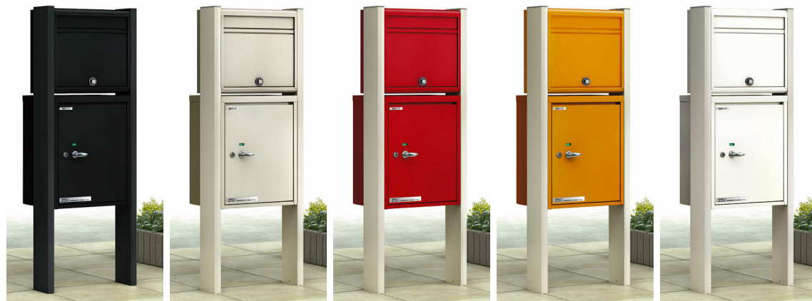
B7:カームブラック H2:プラチナステン VE:レッド VG:オレンジ YW:ホワイト